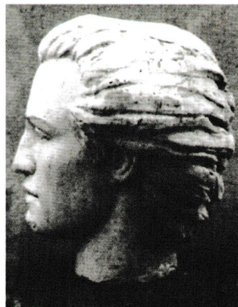
M.Eminescu semnat de Constantin Brâncuși - gips

De altfel, într-un studiu anterior al nostru, în cartea << Mărturii despre artă și viață>> despre Maestru, am arătat că în miile sale de desene descoperim un tumult de energie cosmică ce se dezlănțuie pe sine în efluvii, dar efluvii ce se îmbină și se dirijează luând