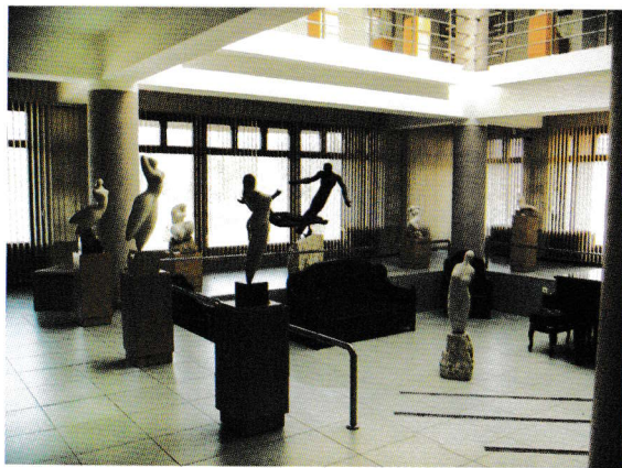
Muzeul Marcel Guguianu

vom arăta cum acest principiu a determinat specificul personal și național al cosmicului estetic pe care l-a făurit acest Maestru. Pentru aceasta vom lua în considerare și vom aplica criteriile și orientările la care trebuie să răspundă operele de artă, stabilite de un mare colecționar de artă plastică, un om de mare rafinament și gust, K. H. Zambaccian(1889-1962). Pornim de la acest om remarcabil, și nu de la un critic sau istoric de artă, deoarece colecționarul rupându-și din pâinea sa ca să cumpere o sculptură,